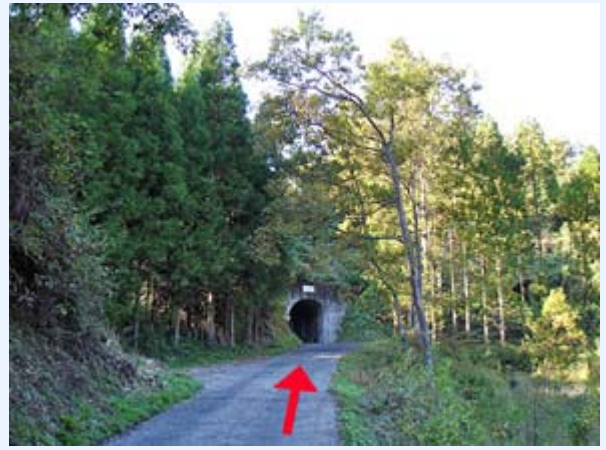
17. 道も細くなり心細くなりますが、どんどん登ります。